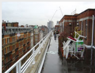
Udnyt tagterrassen optimalt